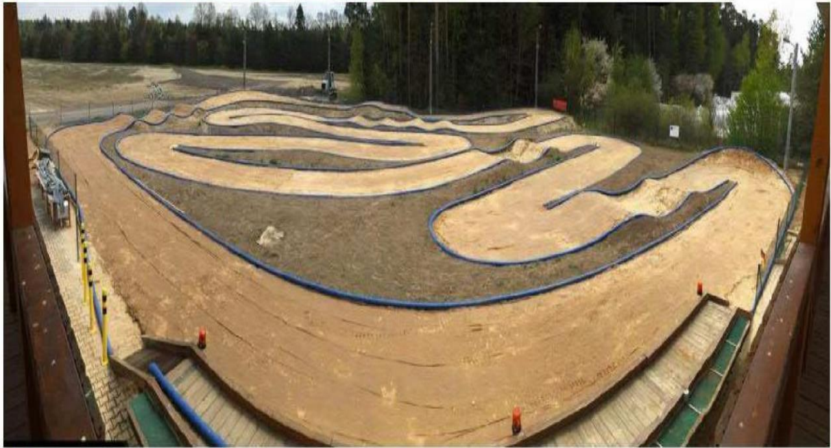
Blick vom Fahrerstand auf Strecke

Wir wünschen allen Teilnehmern eine Gute und sichere Anreise und ein schönes Rennwochenende